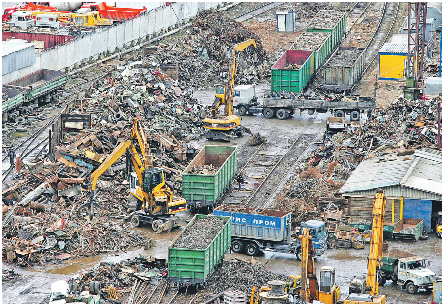
Доля России в экспорте казахстанского лома составляет около 90%

Казахстан с июня перестал поставлять в Россию ЛОМ ЧЕРНЫХ МЕТАЛЛОВ, необходимый для заводов ММК, но продолжил экспорт готовой продукции — стали. Комиссия Евразийского экономического союза усмотрела в этом нарушение конкуренции.