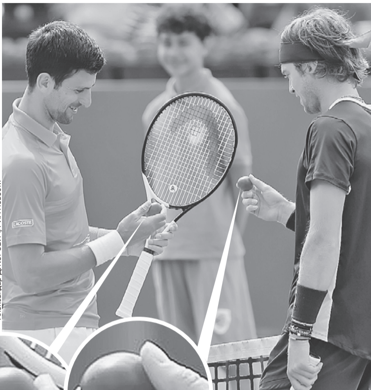
Новак Джокович (слева) и Андрей Рублев перед финалом турнира в Белграде проводили жеребьевку при помощи битья пасхальных яиц (чья выдержит, тот выбирает сторону или подачу).

Вся Европа в марте выходит на грунт, а у нас в средней полосе России это возможно не ранее 20 мая. И кортов нет, потому что все стали стелить хард (современное искусствен-