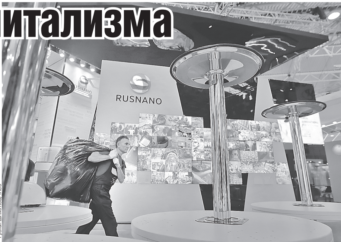
Конечно, были у «Роснано» и успехи. Но провалов - гораздо больше. В результате сотни миллиардов рублей были просто выброшены на помойку.