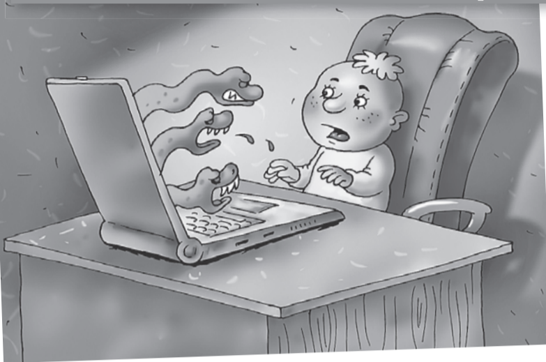
Катерина МАРТИНОВИЧ/«КП» - Москва