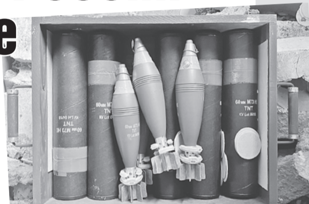
На складах нашлось много боеприпасов из стран НАТО, и прибыли они явно не вчера...

Бросив под Харьковом эти тысячи тонн боеприпасов, Киев значительно упростил здесь жизнь Российской армии. А вот украинские войска теперь вынуждены просить снаряды у своих друзей с Запада.