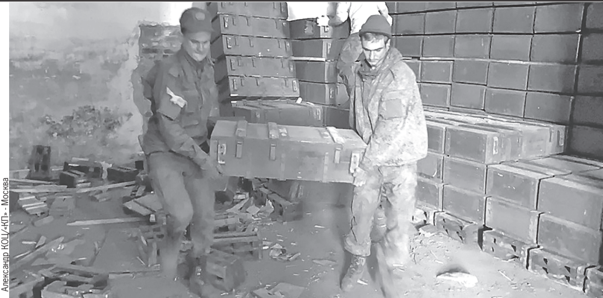
Александр КОЦ/«КП» - Москва

Тысячи тонн снарядов и мин оказались очень кстати для ведения спецоперации.