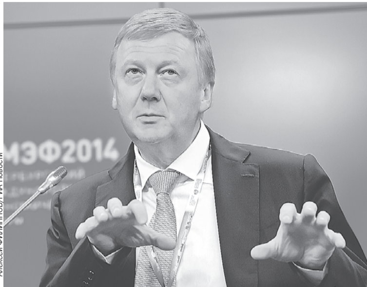
Анатолий Чубайс и его команда стали заниматься инвестициями и нанотехнологиями, не имея представления о том, как все это работает. Отсюда и такое количество провалов.