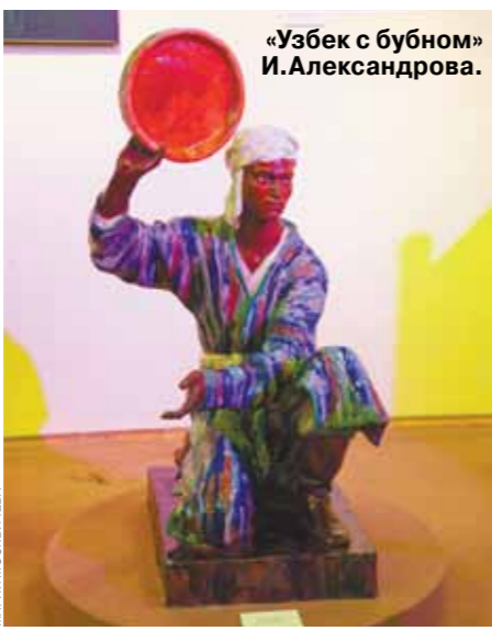
«Узбек с бубном» И.Александрова.

Что: Выставка «Стражи времени. Керамическая скульптура Древнего Китая» и акция «Встречаем вместе» Где: ГМИИ им. Пушкина, Главное здание, зал №31, Волхонка, 12 Когда: 6 декабря — 10 февраля и 31 декабря