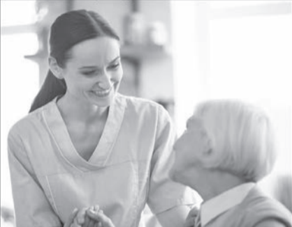
График: 3/3, 4/2 Смена: 4000р