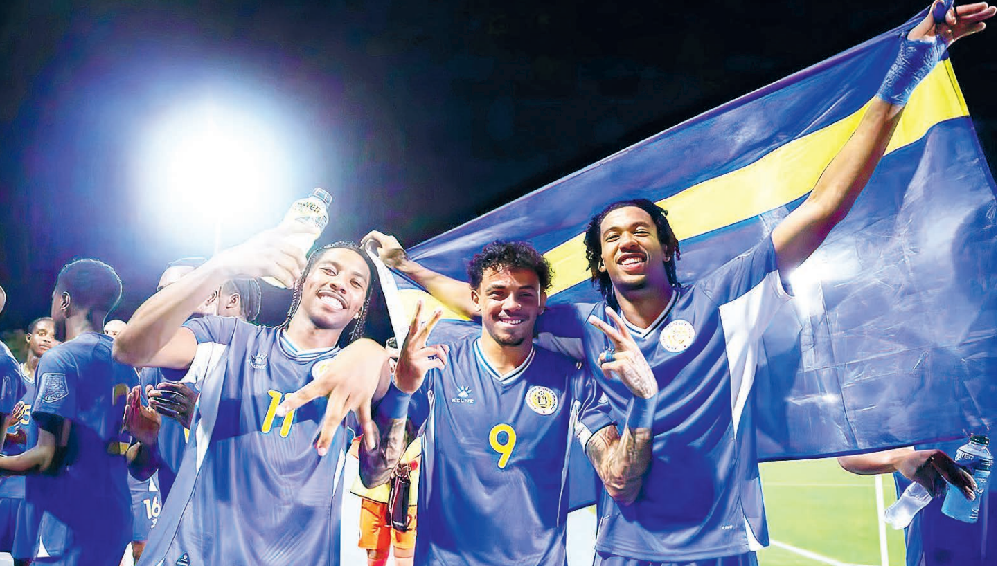
Сборная Кюрасао под руководством Дика Адвоката сотворила главную сенсацию: пробилась на ЧМ-2026!

Никогда еще формула отбора не была столь сложной и запутанной, как сейчас. Первое, что бросается в глаза: количество участников чемпионата мира за минув- шие полвека возросло вдвое, с 16 до 48 команд. Второе: на отборочном этапе олимпийская система с выбыванием проигравших сменилась групповыми турнирами. Третье: даже команды, сы- гравшие на этом турнире из рук вон пло- хо, не теряли шанса. Для неудачников из Европы проведут еще дополнительный отбор. 16 команд (12, занявших в группах